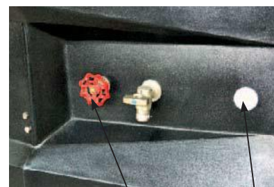
REGULACE PRŮTOKU VODY